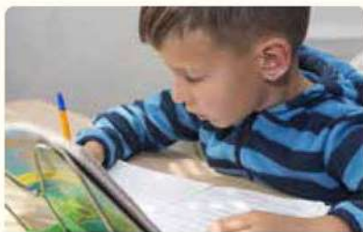
طالب يتأمل قسمة