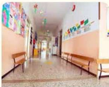
جولة حون المدرسة

فناء المدرسة. حان وقت الصيد! سيأخذك المعلم في جولة حول المدرسة. لاحظ أي دليل على الاهتمام بالبيئة المدرسية.