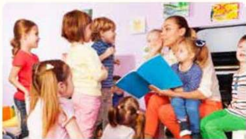
خان وقت القصة

هناك أنواع كثيرة مختلفة من القصص. كم نوعًا مختلفًا منها يمكنك تسميته؟ هل يمكنك إعطاء بعض الأمثلة لأنواع المختلفة من القصص؟