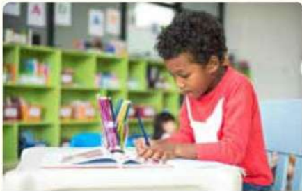
طالِبٌ يَرَسِّمُ قِصَّةً

ازيسم صورةً للقصة التي تُريد سردها عن أحدِ جَوَابِ تَرَائِكِ. تَدَكِّرُ إِذْ رَاحَ أَكْبَرَ قَدْرٍ مُمَكِّنٍ مِنَ التَّفَاصِيلِ لِأَنَّ ذَلِكَ سَيُسَاعِدُكَ عِنْدَ مُشَارَكَةِ القِصَّةِ مَعَ طَلَبَةِ الصَّفِّ.